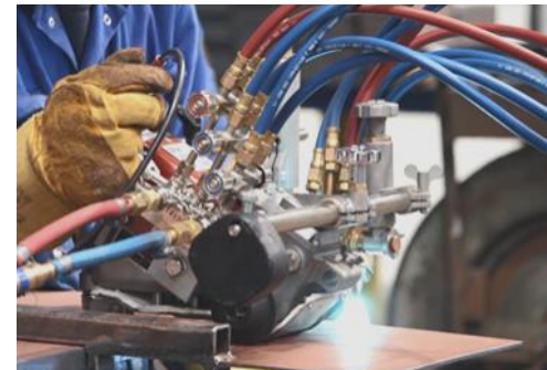
Eén beweging: gas aan/uit