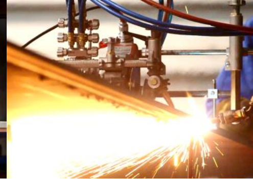
Afkanten (verhouding 1:4 bevellen) enkele toorts