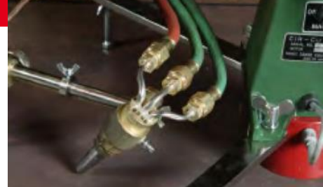
Taglio a smusso